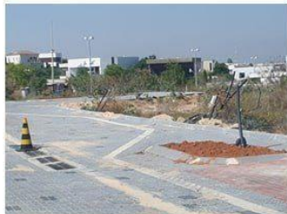
הדולומיט – משמאל לערוגה

ברחובות הכורכר, העפרוני, הדולומיט, נחל שורק צפון ומאדים נקבעו נקודות קבועות להנחת פסולת במפרצי חניה. אין להניח פסולת ליד שטוצר מים או קווי תקשורת, באם המפנה לא מבחין בכך יש סיכוי שיגרם נזק לתשתית.