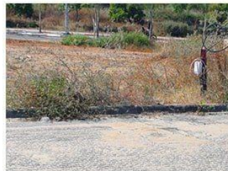
הכורכר – משמאל לעמוד התקשורת ובריחוק ממנו