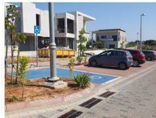
נחל שורק צפון – מימין לחניית הנכה