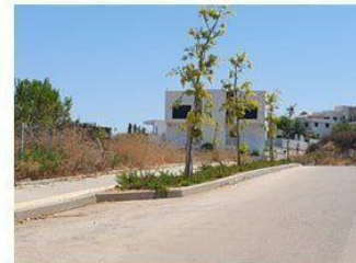
מאדים – במפרץ חניה מצד שמאל