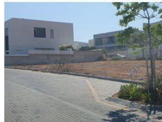
העפרוני – משמאל לערוגה